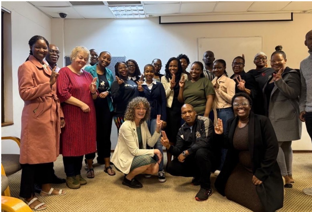
EMDR trainee groep in Gaborone, Botswana