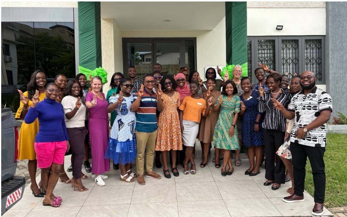
EMDR trainee groep in Accra, Ghana