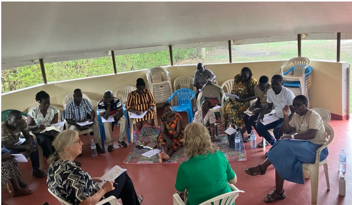
EMDR trainingsdag in Gulu, Oeganda

In Kampala hebben we voor de eerste keer in 2025 de opleidingsfase kunnen afronden met deelnemers die in 2023 en 2024 de EMDR opleiding zijn begonnen met een "Certificate of Completion". We hebben in Kampala aan 12 deelnemers zo'n certificaat kunnen uitreiken. Wij zullen ze ook na de formele projectfase blijven uitnodigen om afspraken te maken om te praten over hun ervaringen met EMDR en de vragen die ze daarover hebben.