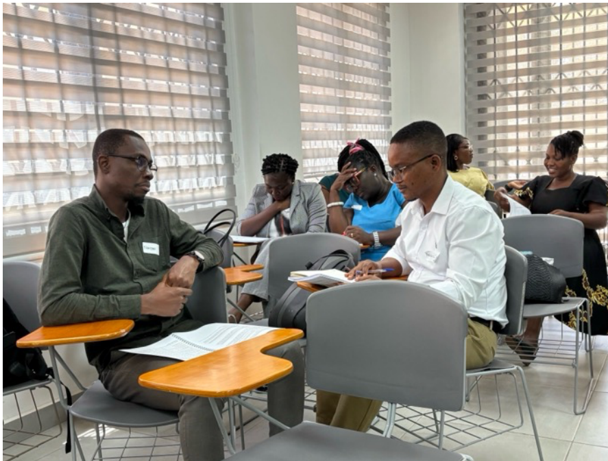
EMDR Trainees aan de slag tijdens een training in Accra, Ghana

terugkomdagen in november 2025. De supervisies vinden plaats in de eerste helft van 2026.